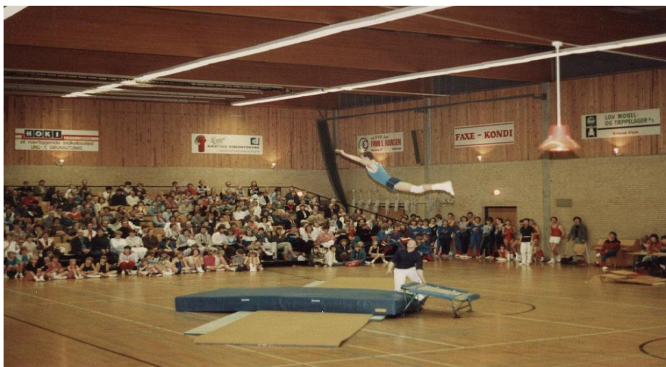
En modig springgymnast