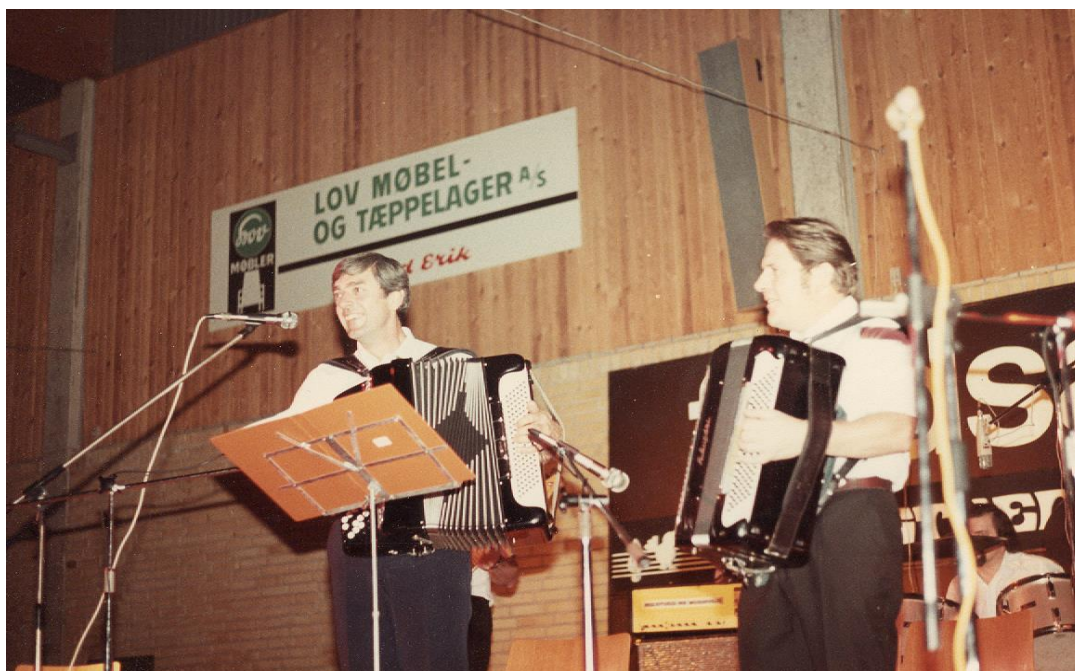
To glade harmonikaspillere på scenen i Fladså-Hallen

Der har været harmonikaspillere fra både St. Petersborg og fra Sverige.