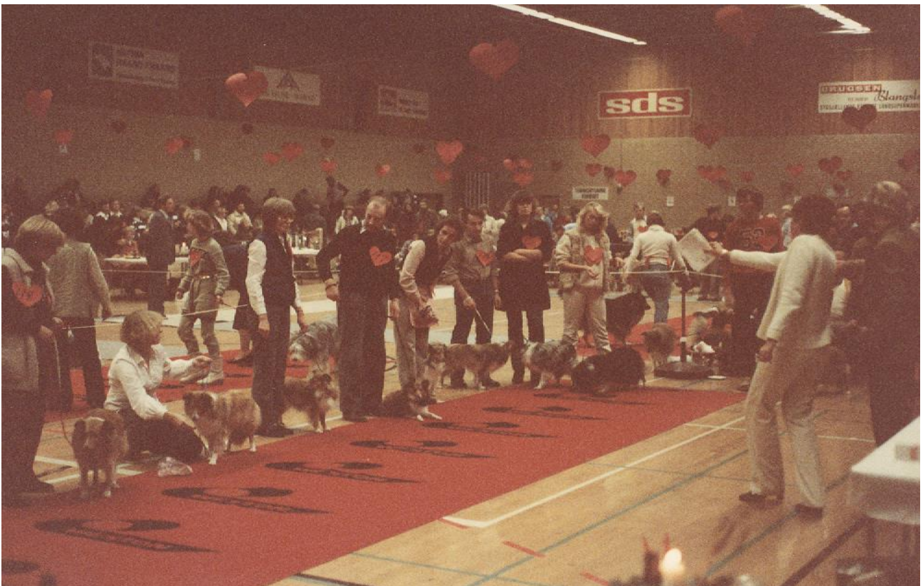
Hundene bliver bedømt af dommerne.

I januar 1988 havde Dansk Retrieverklub sit årlige hundeskue i Fladså-Hallen og 160 retrievere med deres ejere havde fundet vej til hallen. Her fik dommerne travlt med bedømmelserne på hundene.