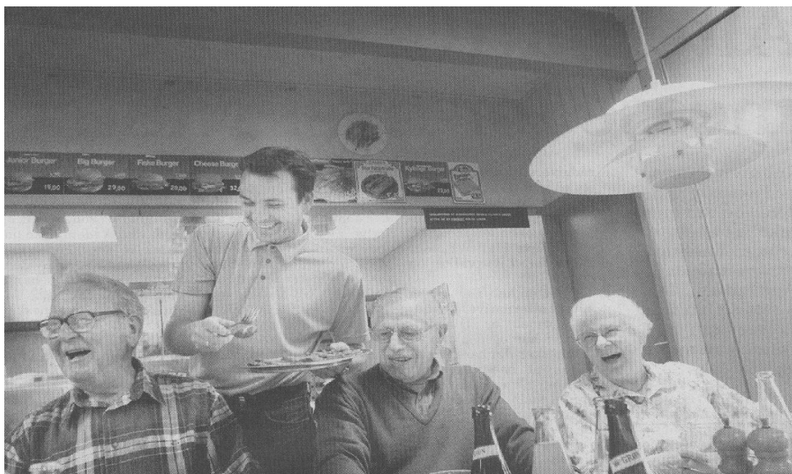
Pensionisternes fællesspisning.

udlejning til foreningernes benyttelse primært på hverdage og til private, som holder fest primært i weekenden.